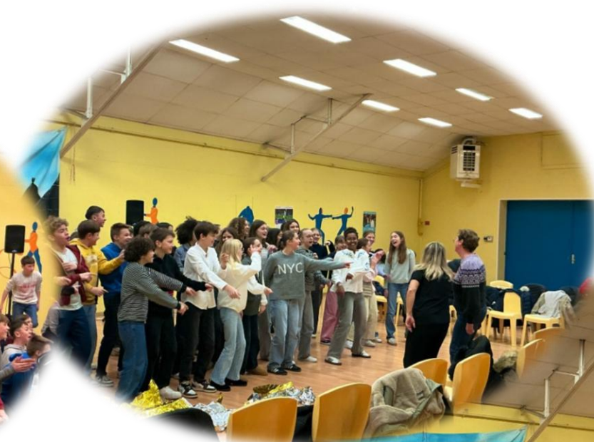
Compagnie A Corpo: Echos du corps