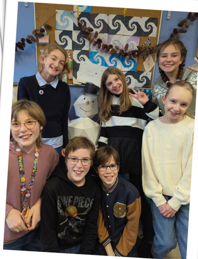
Mathématiques 5èmes : Les 5e ont fabriqué le traditionnel bonhomme de neige !